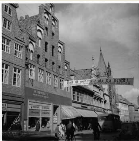
In Nürnberg weisen Spruchbänder über den Straßen auf die Zeltmission hin