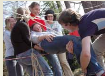
Bei den Freizeiten der Familienerholung gibt es manch interaktive Spiele