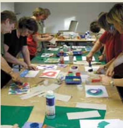
Wer seinen Schaukasten interessant gestalten möchte, muss vorher kreativ werden