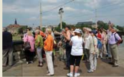
Ein Amtsausflug führte nach Dresden