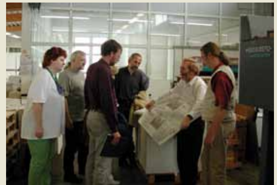
Gemeindebriefmacher erkundigen sich in einer Druckerei, wie es die Profis so halten