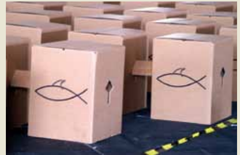
Die Beteiligung verschiedener Arbeitsfelder an den Kirchentagen gehört zum Standardprogramm