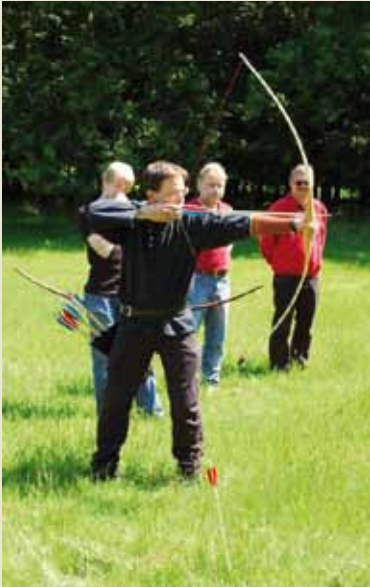
Männerarbeit und Bogenschießen