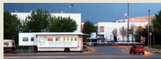
Campertreffen auf dem ÖKT in München mit der frischlackierten Autokirche