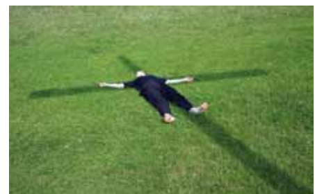
Zur Ruhe kommen – wahrnehmen, was man(n) so tut