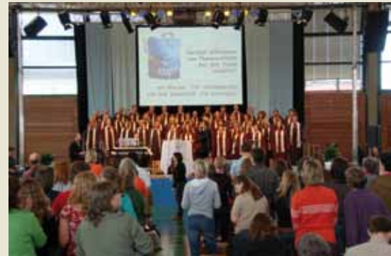
Die Landeskonferenzen der Kirche mit Kindern sind immer gut besucht, das Programm wirkt in die Gemeinden zurück

afg und Landeskirche beteiligen sich bei dem Projekt „ganz jung, ganz alt, ganz ohr“ der Staatsregierung