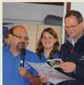
Die neue CD der Kirche unterwegs wird auf dem Campingplatz in Marina de Venezia der Leitung übergeben