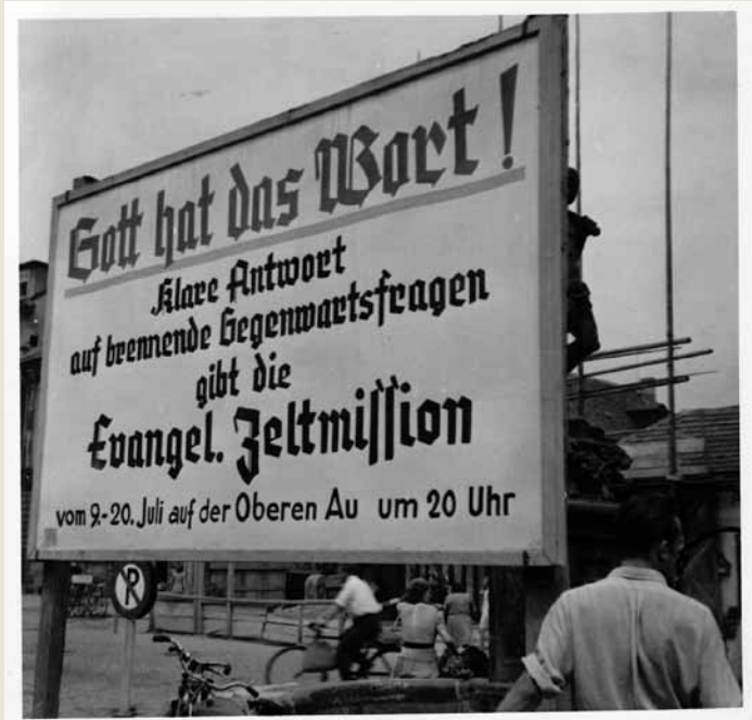
Die Zeltmission wird groß mit Tafeln angekündigt