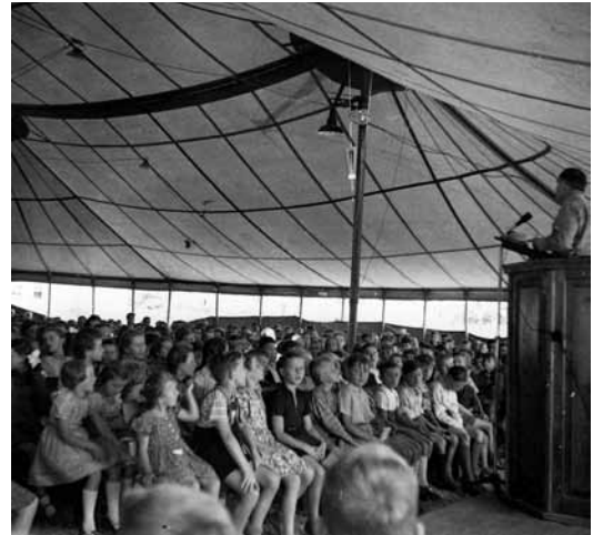
Kinderstunde während der Zeltmission

Die kirchlichen und gesellschaftlichen Rahmenbedingungen haben sich mit den Jahren grundlegend geändert. An die Stelle von zahlenbeeindruckenden Großveranstaltungen treten mehr und mehr passgenaue, milieusensible missionarische Projekte, die den Einzelnen im Blick haben.