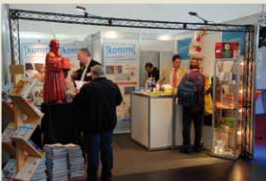
Das afg ist Gründungsmitglied und seit über 40 Jahren Partner des Evangelischen WerbeDienstes